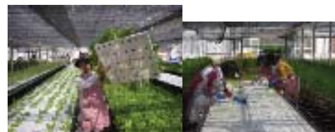
水耕栽培されたレタス

平成21年10月7日より、奈良県中小企業団体中央会の主催で、開塾されました農商工連携人材育成塾に参加させて頂きました。今回の体験学習は、三重県鈴鹿市の農業法人「日本食林(株)」の水耕栽培での研修でした。