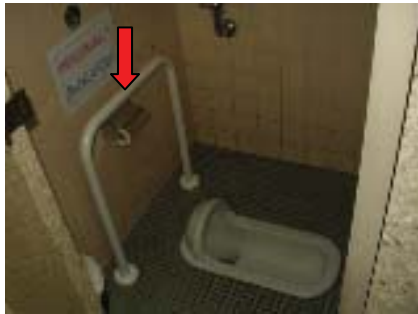
庁舎中央棟1階設置状況

本年4月末に、奈良市役所庁舎内の女性用トイレに手すりが設置されました。市民の声を届け、約2週間程度で、工事が完成